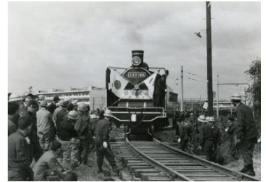
新津第一小学校へ自走するC57 180号機