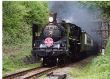
平瀬トンネルを出るSL ばんえつ物語

2024年7月27日（土）～10月21日（月） 9:30～17:00（入館は16:30まで） ※休館日：毎週火曜日 ※特別展の観覧には入館券が必要です。