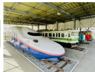
屋外常設展示の一例